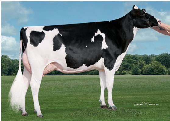
SIEMERS DOORMAN ROZ THIRD DAM