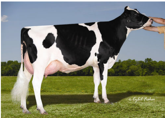
CHERRY CREST MANOMAN ROZ FOURTH DAM